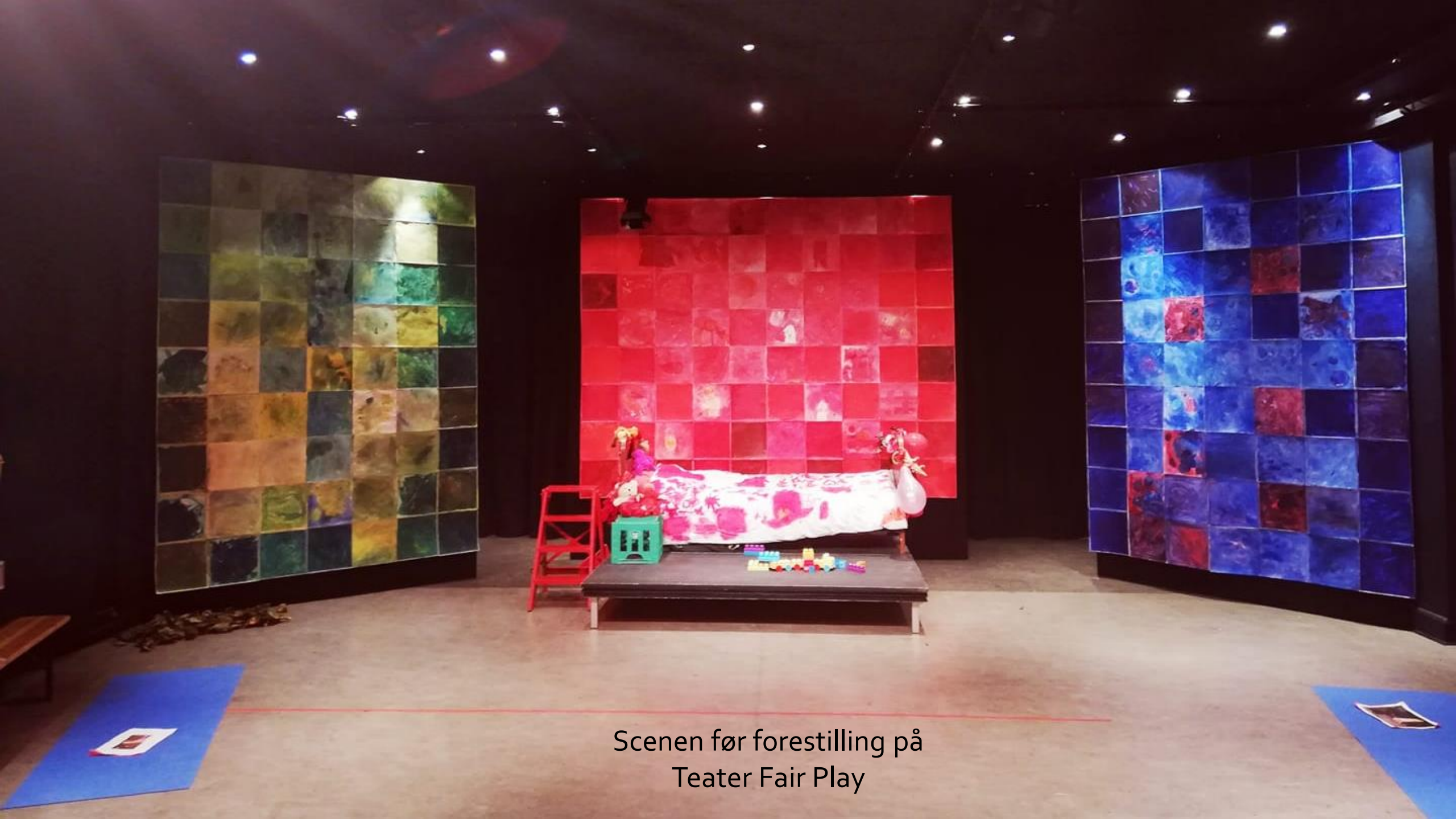
Scenen før forestilling på Teater Fair Play