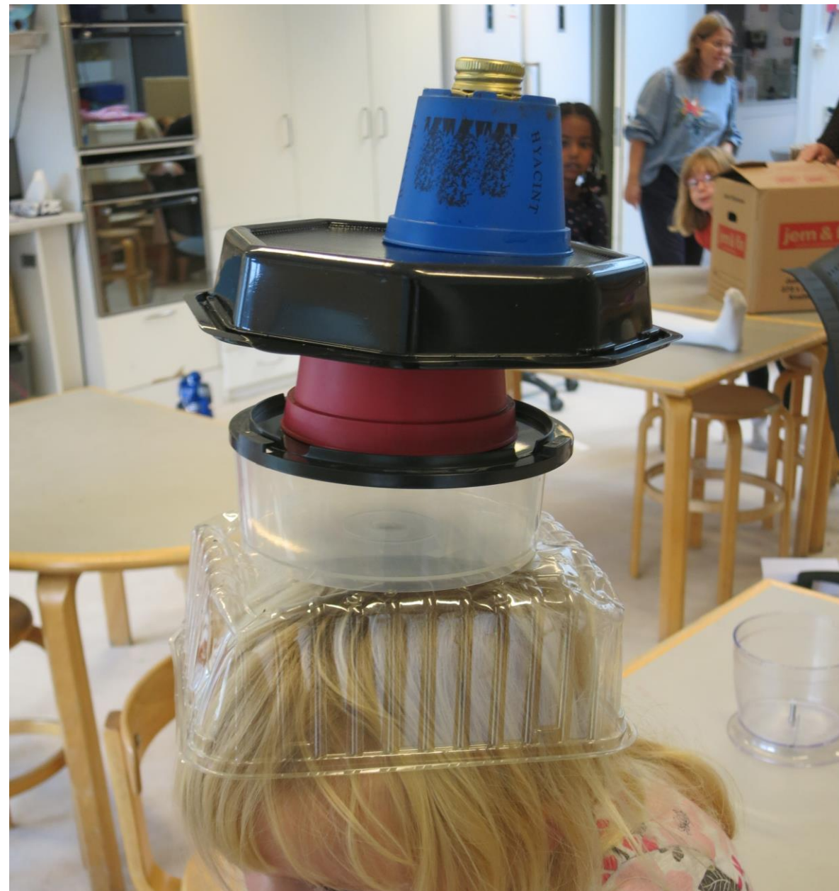
Børn og pædagoger arbejder med 'balance' og leger sig frem til scener i et teaterstykke