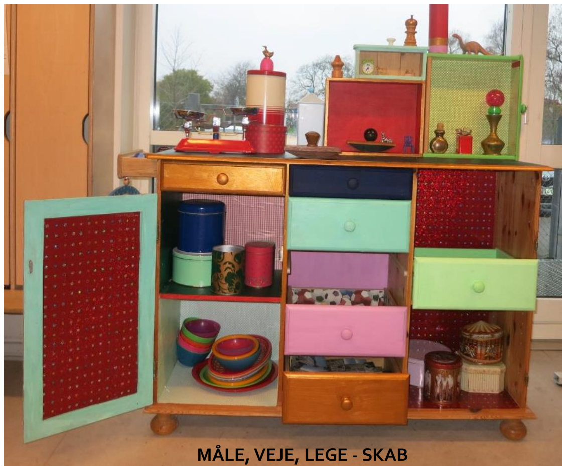
MÅLE, VEJE, LEGE - SKAB